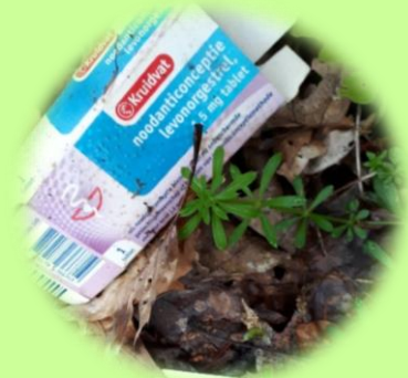
Noodanticonceptie, gevonden langs de Regte Hei ☺

Wij zijn erg benieuwd hoe actief jij zapt en naar jouw verhaal en leuke, grappige of indrukwekkende foto's. Tof als je ze ons toestuurt voor de volgende nieuwsbrief!